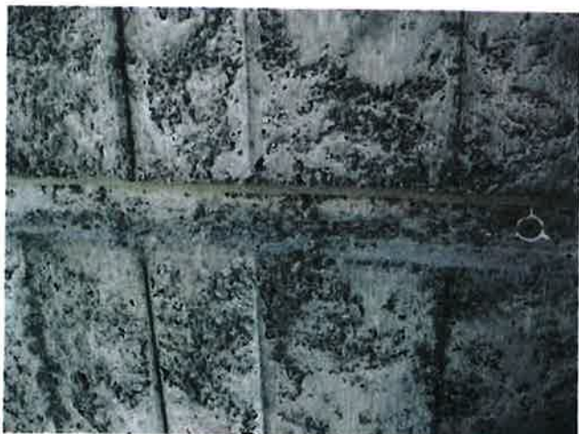
Bild 4 u. 5 Neue und alte Scheinfuge.