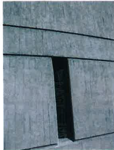
Bild 3 Die fertige Oberfläche.

reichender Verdichtung zu sehen. Verdichtungsprobleme führten zu einem auffällig hohen Anteil an Grobporen und Lunkern. Teilweise wurden Löcher und Hohlräume von bis zu 12 cm Tiefe festgestellt.