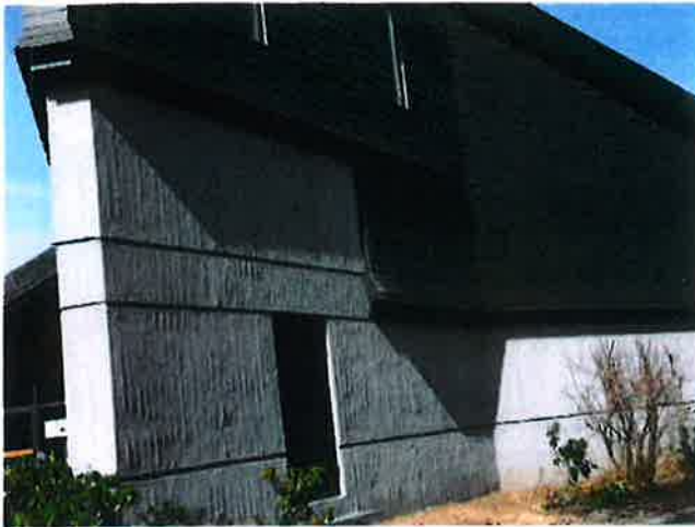
Bild 2 Nach der Instandsetzung wurde der untere Fassadenbereich als Sichtbeton ausgearbeitet, während der obere Bereich nach Abstimmung zwischen dem Bauherrn, der evangelischen Kirchengemeinde Sarnau sowie der beteiligten Architekten Himmelmann und Schneider-Lange eine Vorsatzschale aus Schiefer erhielt. Gut zu sehen die Scheinfugen, die die Oberfläche strukturieren.