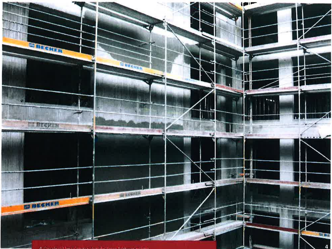
4 - Fassade mit bereichsweise überschrittenen Rohbauleistungen